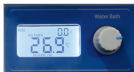
Panel sterujący łaźnią wodną